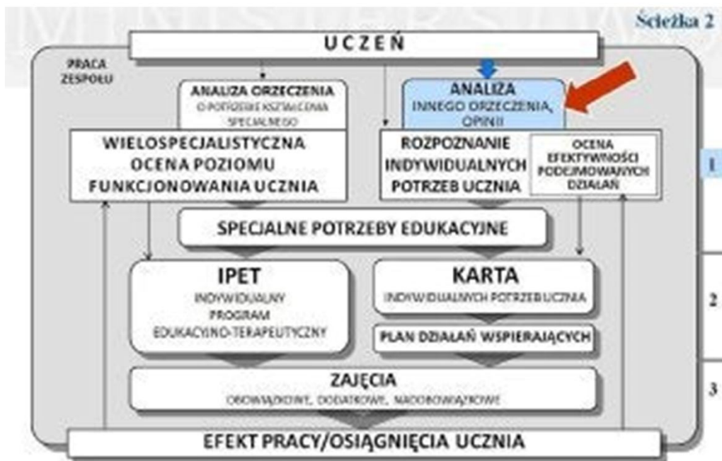
1 – POZIOM DIAGNOSTYCZNY, 2 – poziom programowy, 3 – poziom praktyczny